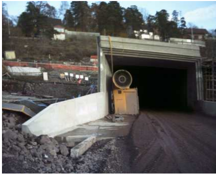
Fig10: Tunnelvannet kom fra tunnelarbeidet i Frodeåsen.

Etter forurensede utslipp av tunnelvann til kortenbekken er statens vegvesen pålagt å fjerne de forurensede sedimentene i bekken. (se vedlegg 2) Statens vegvesen har innrømmet at utslippene som ble sluppet ut, kom fra anlegget. Mengden med mudder som skal fjernes er om lag 8 \text{ m}^3 . Tunnelvannet fra tunnelanlegget ble i 2004 pumpet til ett overvannsystem som førte til kortenbekken. Det er utført analyser av forurensningene, kartlagt forurensningsgrad, utbredelse av sedimentert tunnel slam, og vurdert de biologiske konsekvensene for naturreservatet.