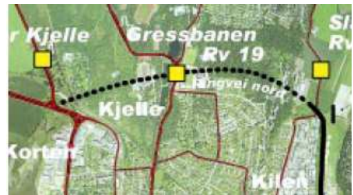
Figur 3: Kart over fase 1

Tønsbergpakken i Tønsbergområdet er et samarbeidsprosjekt mellom kommunene Tønsberg, Nøtterøy og Tjøme. Dette prosjektet omfatter bygging av vei på rundt 3,5 km, og av det skal 1,9 km gå i en tunnel gjennom Frodeåsen. Frodeåsen ligger like ved våtmarksområdet Ilene.