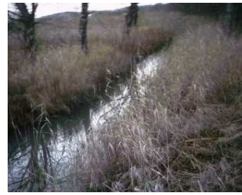
Figur 1: Kortenbekken

Kortenbekken i Tønsberg er en bekk som renner ut og ved siden av Ilene våtmarksområde og naturreservat. Dette er et av Norges Ramsarområder. Vi har tatt for oss noen av problemene rundt dette området. Statens Vegvesen er tidligere blitt politianmeldt for å ha forurenset nettopp denne bekken, og Statens veivesen fikk en stor bot.