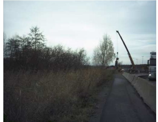
Fig 6: Det er vanskelig å tro at arbeidet med Tønsbergpakken ikke påvirker Ilene.