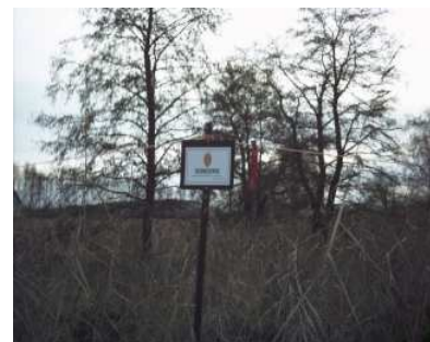
Fig 5: Ilene er som andre Ramsarområder i Norge, allerede vernet.