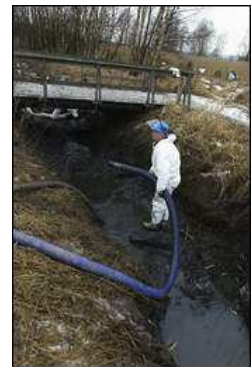
fig 11: opprydding i Kortenbekken

Fylkesmannens miljøavdeling vil starte et prosjekt for å undersøke hva som kan være kilden til oljesølet i Kortenbekken. Når oppryddingsarbeidet var ferdig måtte Statens Vegvesen levere rapport over hva slags tiltak som ble utført og en dokumentasjon på at all forurensing er fjernet.