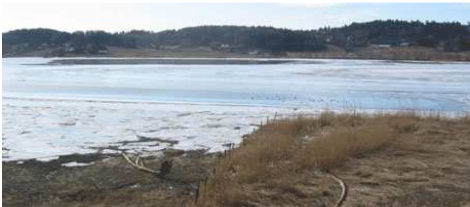
Fig 8: Ilene våtmarksområde har et stort biologisk mangfold, og ligger nær oslofjorden.

Næringsstoffer avsettes også her, slik at det blir en høy produksjon av alger, snegler, muslinger, og andre næringsdyr. Dette er altså et av de områdene i landet som har størst verneverdi.