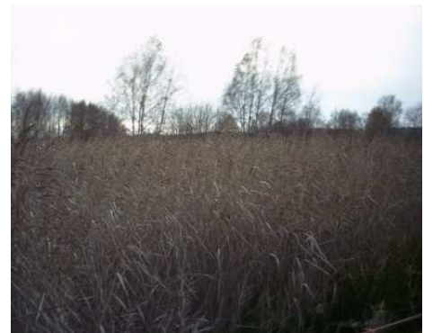
Fig 7: Ilene våtmarksreservat

Det er til sammen registrert ca 240 fuglearter på Ilene. Grunnen til mangfoldet er de store og sammenhengende gruntområdene som vises ved fjære sjø. Her kommer det næringsstoffer fra sjø, elv og bekker og tilsig, som fører til stor produksjon av alger, snegler, muslinger og andre næringsdyr.