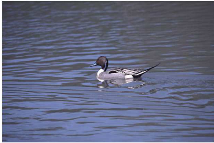
Fig 9:Røddlistearten stjertand som stadig sees på Ilene

Det er forsket på hvordan fuglene har reagert i forhold til mye trafikkstøy, og det har da blitt mindre fugl i området.